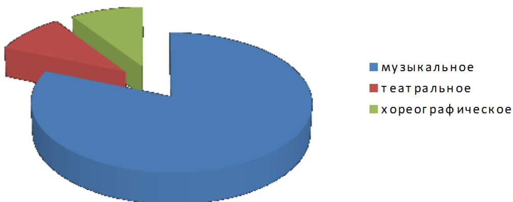
Обучающиеся по направлениям

Можно отметить, что интерес и желание обучать детей в МБУДО «Орловская детская хоровая школа» возрастает с каждым годом. Потребность в музыкальном образовании растет, и школа, выполняя социальный заказ населения, ведет работу в различных образовательных направлениях: музыкальном, хореографическом, театральном.